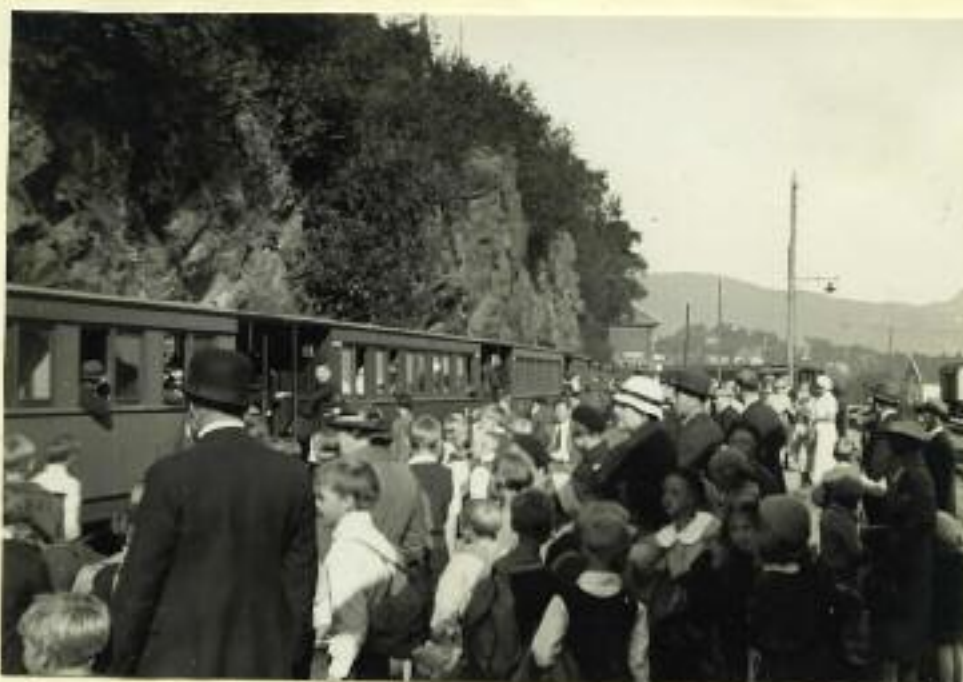
Litt av menneskemassen som var møtt opp på Nesttun stasjon den 1. sept. 1955, for å ta avskjed med Osbanen.