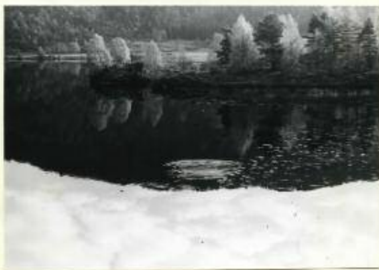
Utsikt fra banen mot Klokkarvatnet, mellom Fana og Hamre.

Osbanen gikk for det meste gjennom et meget vakkert og vekslende landskap med mange idylliske bekker og tjern. Der var ingen tunneller, men mange skjæringer, fyllinger og små-broer.