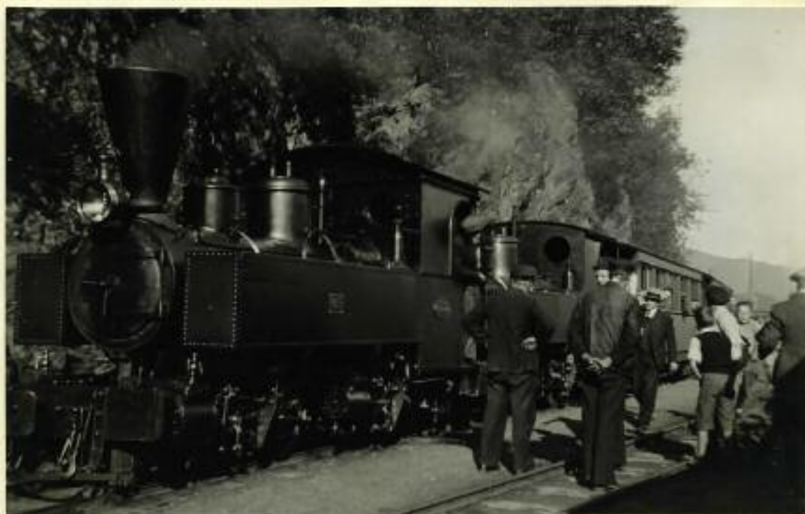
"Os og Ulven" foran det siste toget fra Nesttun. Det går tydelig an å se hvordan stemningen er blandt banens funksjonærer.