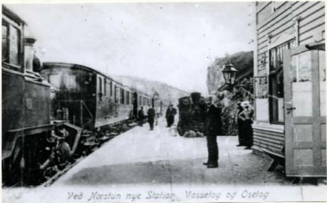
Ved Næstun nye Station, Vosselag og Osetag

I 1894 ble det som fast personale ansatt: 1 driftsbestyrer, 1 stasjonsmester (Osören), 6 banevoktere, som også gjorde tjeneste som stasjonsmestre på mellomstasjonene. 1 overkonduktør, som også gjorde tjeneste som lokomotivmester m. m. 1 fører. 2 fyrbøtere. 1 pusser. 2 konduktører.