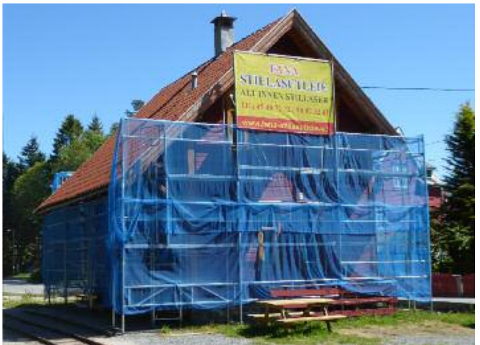
2) Stillaset er på plass i juni 2018

siste årene, samme grønnfarge på dørene og en noe lysere gulfarge på vindusinnramming og lister. Ved et besøk på arbeidsplassen avslørte at det hadde oppstått en misforståelse mht. gulfargen. De hadde