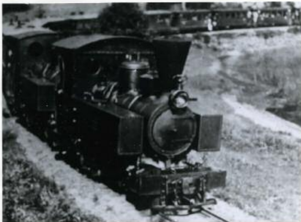
Det var mange skarpe kurver på Osbanen

Den første maskinen som kom var en 7 tonns Decauville-maskin, de to neste var litt større ( 9 tonn ) men av samme type.