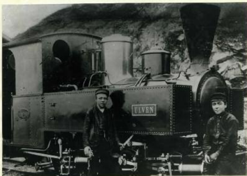
Pusseguttene i arbeid. Lokomotivene var alltid rene og blanke.

Alle lokomotivene var utstyrt med to navneskilt av messing, et på hver side. Ellers var alltid maskinene rene og blankpussete, det var liksom om lokomotivførerne satte sin ære i å holde maskinen sin ren og blank.