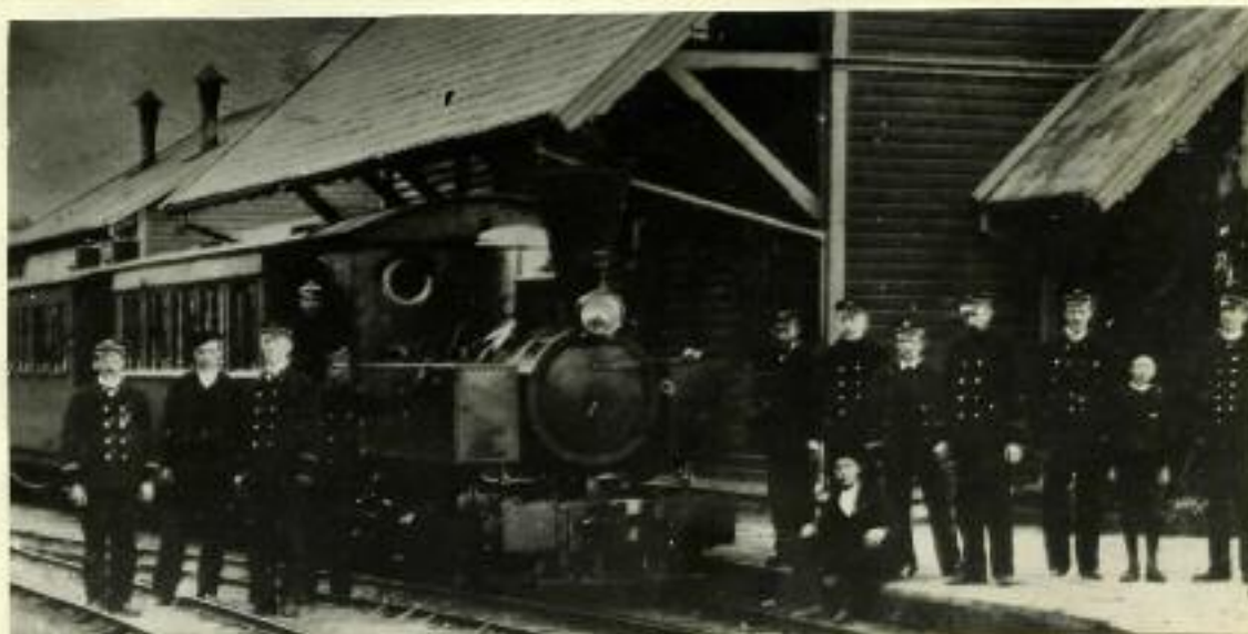
Fra Osøren stasjon åpningsdagen.

Forventningene til banen var store, og åpningen var imøtesett med atskillig spenning og forventning. "Bergens Tidende" hadde dagen før en leder om begivenheten, der det bl.a. heter at det etter de oppstilte ruter vil medgå 2 timer og 15 minutter å kjøre fra Bergen til Os. Den tertiære bane byr altså i sammenligning med dampskipene en tidsbesparelse på 1\frac{1}{2} til 2 timer, og da billettprisen tur og retur er satt til kr. 1,65, tillike en ikke ubetydelig pengebesparelse.