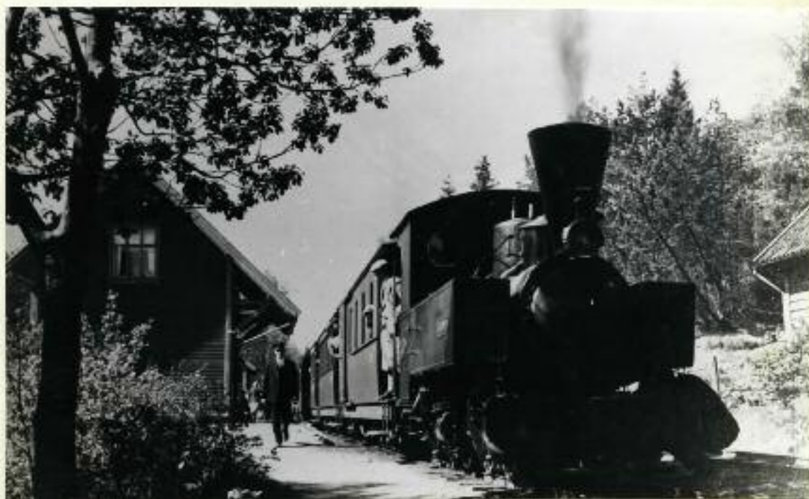
"Bjørnen" på Stend stasjon.

Man ser best av de vedlagte kart hvordan banen gikk i terrenget.