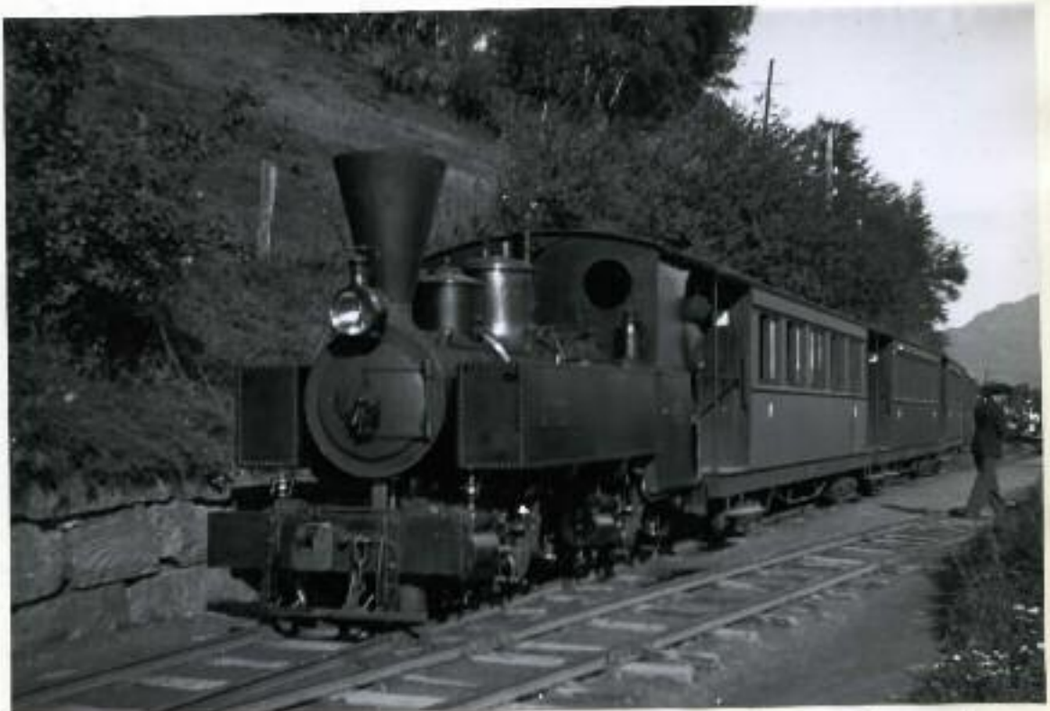
"Ulven" på Nesttun stasjon. Bildet gir et inntrykk av hvordan vognene var.

De første åtte passasjervognene ble levert fra en fabrikk ved navn Oldbury i England. De hadde 32 sitteplasser og var 1,75 m. brede. Senere fikk banen nye vogner fra Skabo i Oslo. Alle vognene var midtgangsvogner med ett sete på den ene siden og to på den andre, og åpen plattform i begge ender.