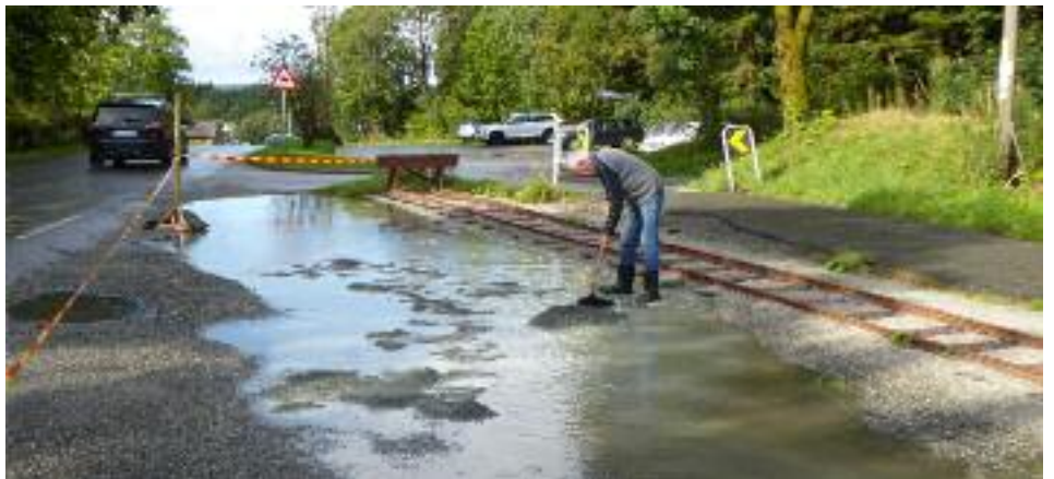
Parkeingsplassen så ut som en innsjø! Under: Knut Aam planerer