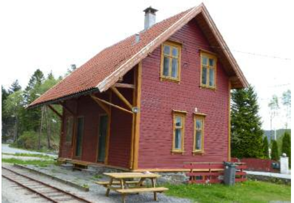
1) En malingslitt Stend st. april 2018

Utover i juli gikk arbeidet med skraping, vasking og maling sin gang i det tørre været. Fargene var avtalt, en noe dypere rød enn det som hadde vært på bygningen de