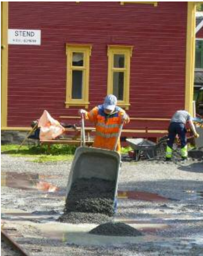
Melheim tipper og Tautra spar