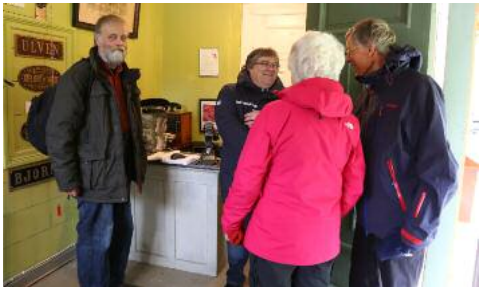
To glimt fra søndag 7. juni.

Så var det den vognen som plutselig forsvant. Det har ikke manglet på spørsmål om hvor den var blitt av, og vi måtte si som sant var at "den står ribbet i vognhallen". Det var enda vanskeligere å svare på når den igjen kan stå foran stasjonsbygningen. En søndag overhørte et par av vaktene en diskusjon mellom barn og foreldre om hvor toget var. Det siste utsagnet fra moren var – mens hun pekte mot lokomotivet: "Der står bakerste vogn!"