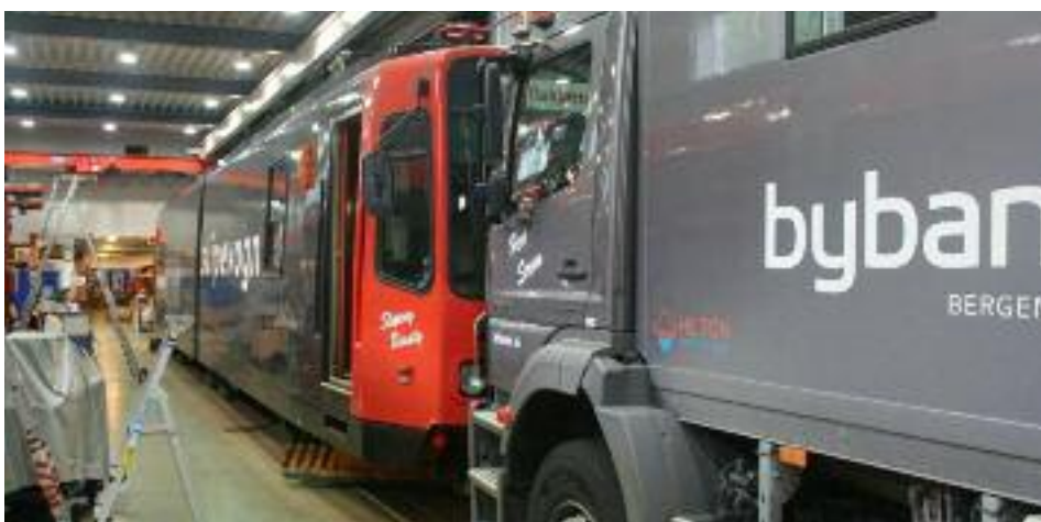
"Sliping Beauty" og "Herr Strøm"