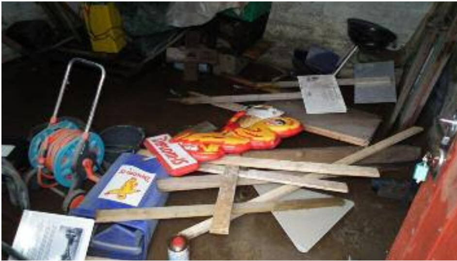
Resultat av oversvømmelse.