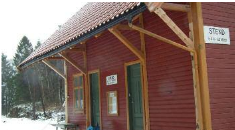
Friskt treverk har erstattet råttent. Foto: Ingvard Aam februar 2015