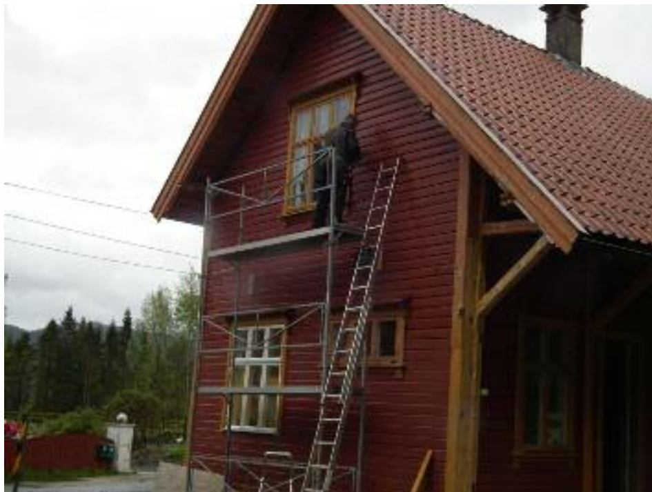
Her er vinduet i første etasje satt inn igjen mens det i 2. etg. taes ut.