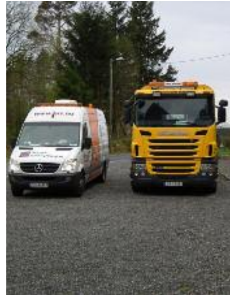
Spyle- og inspeksjonsbil på veg til Stend.

Rørene ble grundig gjennomspylt og rensert før folkene i kamerabilen kunne begynne sitt arbeid. Kamera med lys ble ført igjennom rørene fra kjellerhalsen og mot septiktanken. Det ble tatt mange bilder, feil ble notert og markert med eksakte avstander. Rørene gjennom Titlestadvegen var noe skadet. På sørsiden av vegen var rørene fullstendig kollapse.