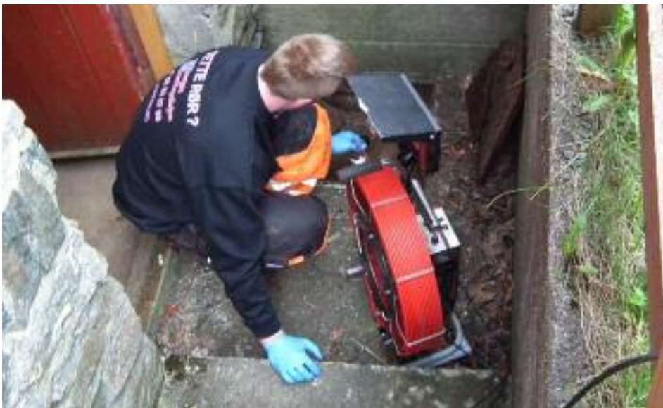
Klar for inspeksjon av kloakkledninga.

Det er ofte veldig fuktig i området rundt stasjonen, og når det i tillegg har kommet store nedbørmengder står vannet høyt over kjellergulvet, helt opp til 70 cm. Vi visste ikke om dette skyldtes at grunnvannet sto høyt, eller kanskje kunne det ha noe med kloakkanlegget å gjøre? I alle fall bekymret det oss. På et møte med huseier, Hordaland fylkeskommune høsten 2013 ble dette tatt opp, og responsen var svært positiv. "Dette må vi finne ut av".