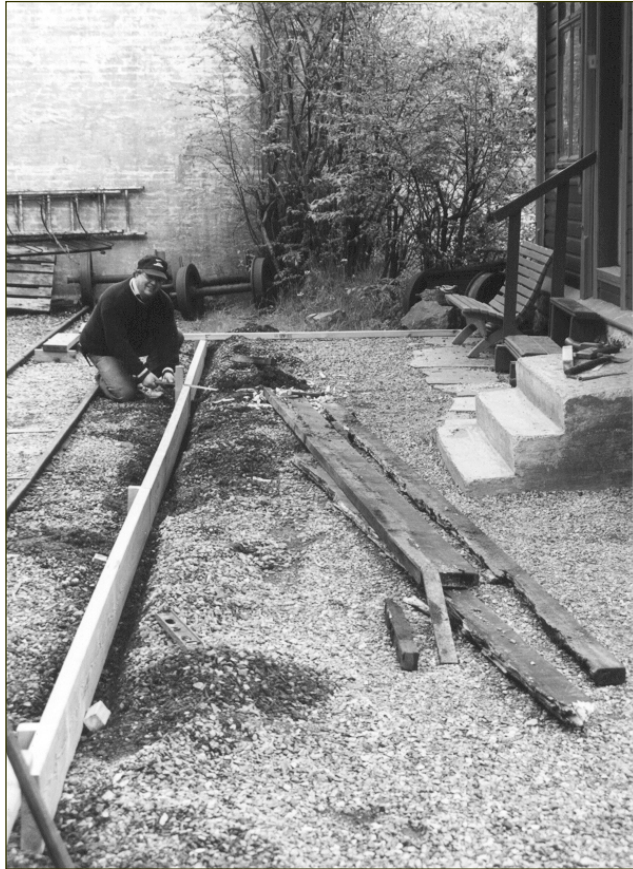
Dugnadsarbeid. Reparasjon av perrongen på Stend stasjon våren 1999.