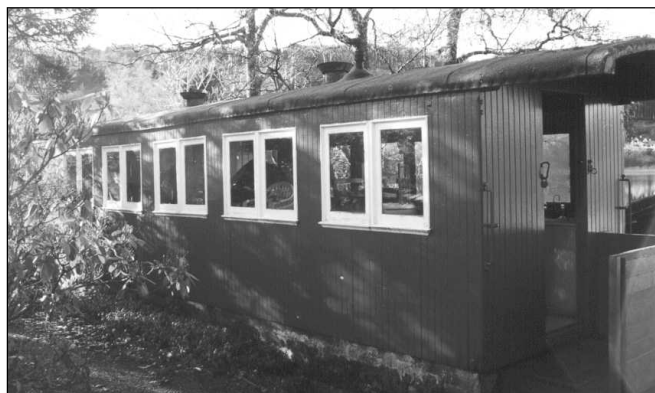
Vognkassen som står på Kismul. Foto i 1998.